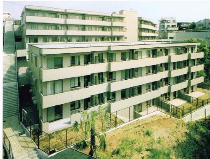
コートハウス日吉本町