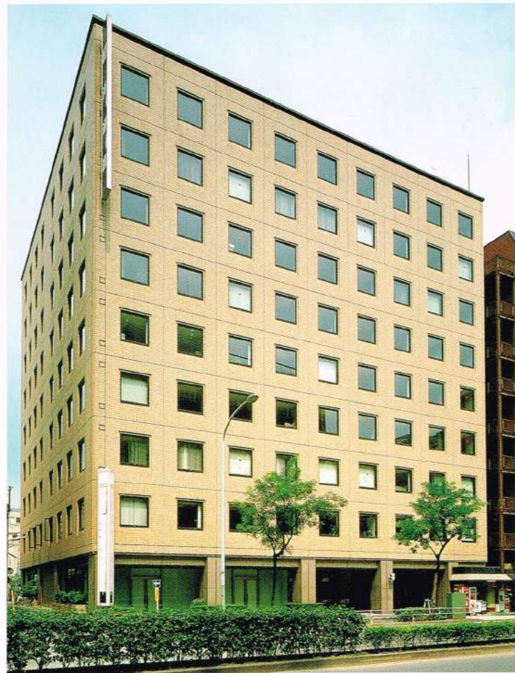
ランディック新橋ビル