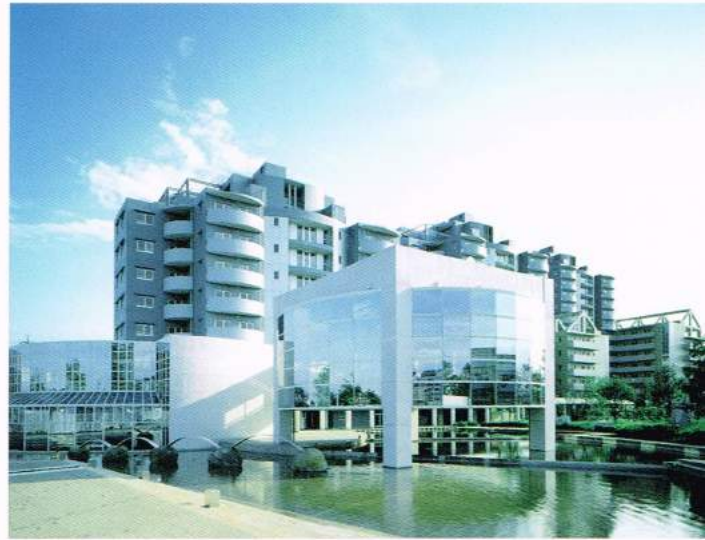
千葉ニュータウン中央NEO

日本ランディックの住宅事業は、マンションの分譲を中心に、戸建て住宅から社宅、宅地開発、ニュータウン開発と幅広く、いずれのプロジェクトも「良質」と高い評価をいただいています。とくに、着実な実績を示しているマンション事業は、「画一的な商品企画ではなく、あくまでも一つひとつが個々のニーズに対応したキメ細かい住宅づくりを目指す」というコンセプトで徹底されており、これまで7,000戸以上の住宅を、ご好評をいただきながら提供してまいりました。現在、企画段階から一貫して良質な住宅づくりに取り組んできた豊富な実績とノウハウを生かし地域再開発型の大型プロジェクトにも参画するなど、人と環境との共生が欠かせない21世紀の住環境づくりに向けても積極的にプランを開発、提案しています。