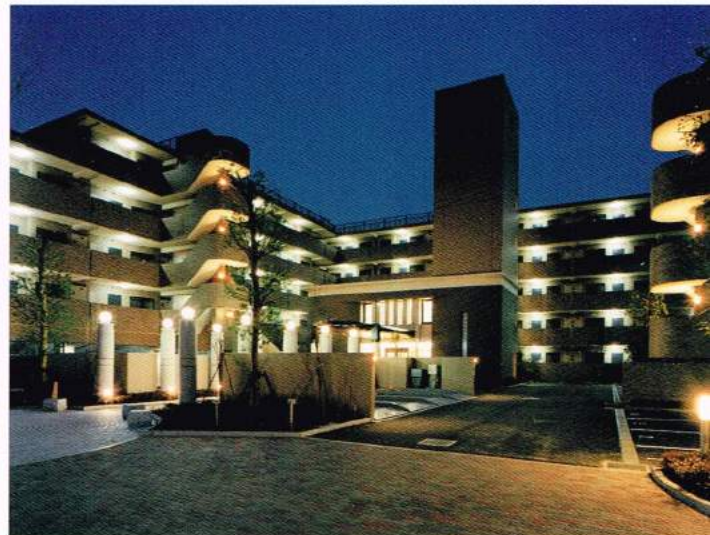
グランクレスト上祖師谷