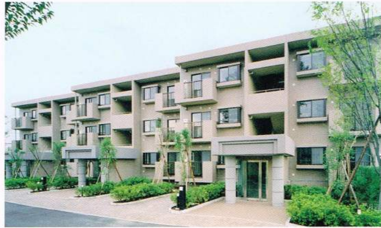
コートハウス一橋学園