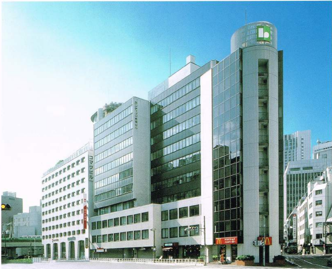
ランディック赤坂ビル