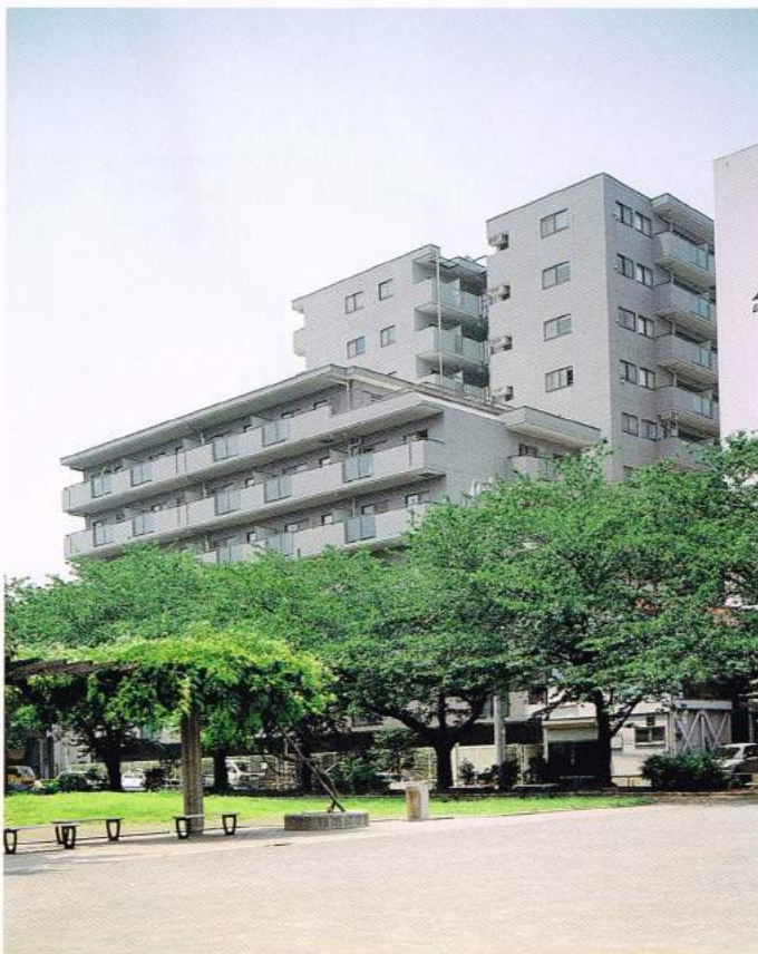
エルハイム西横浜