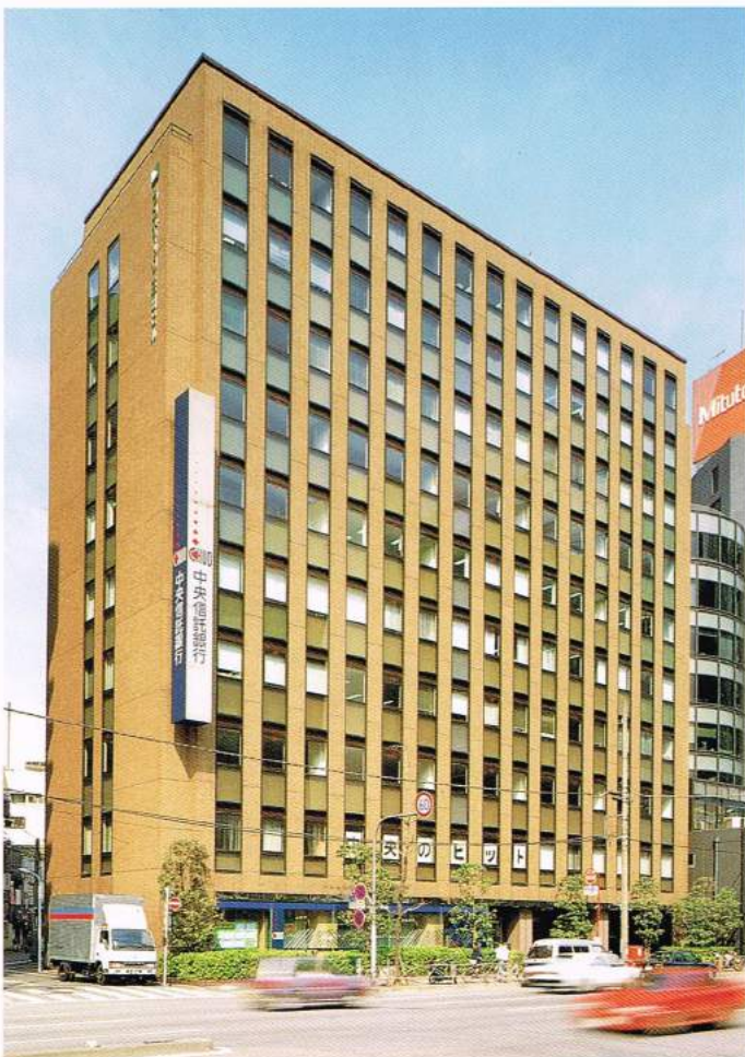
ランディック三田ビル