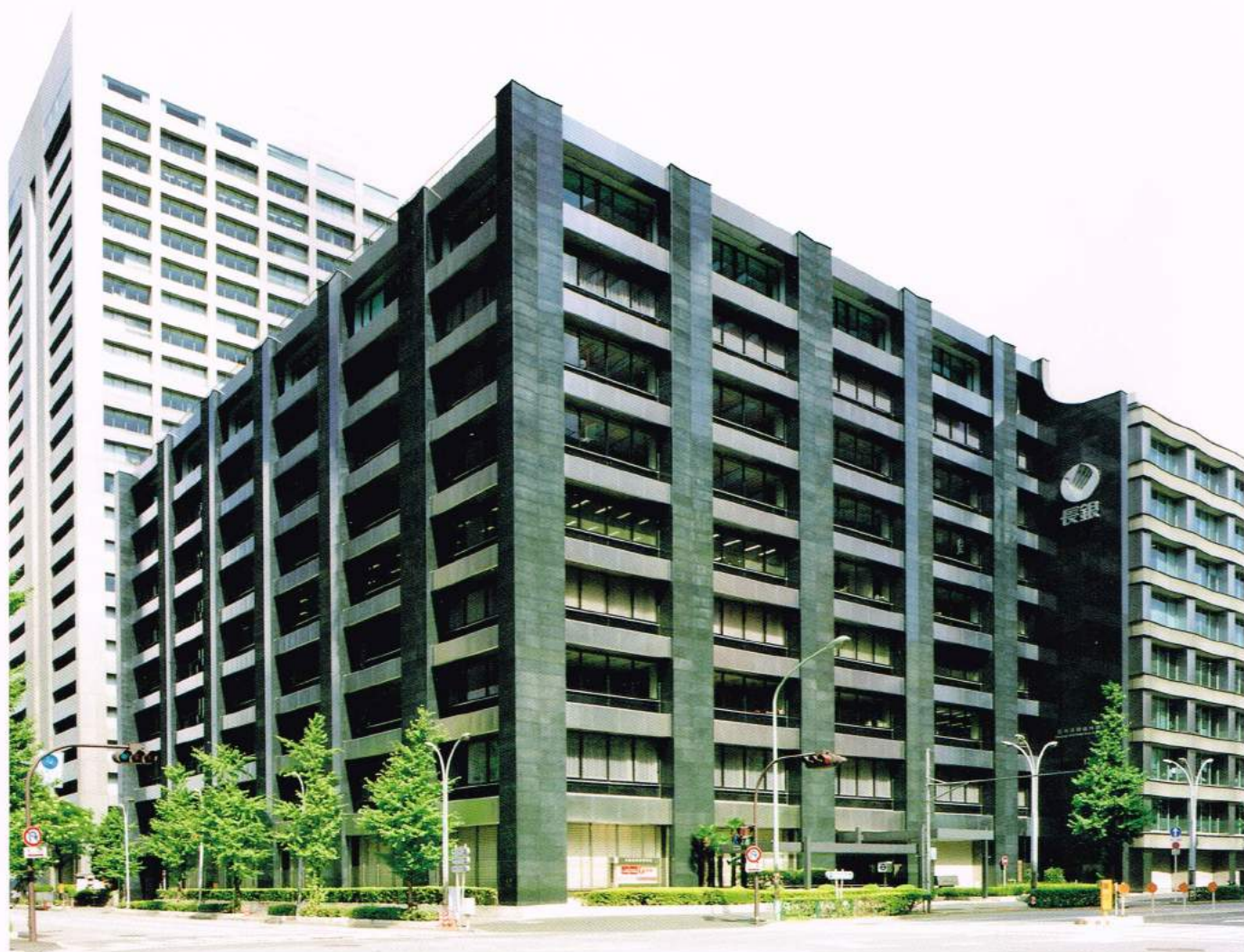
ランディック大手町ビル