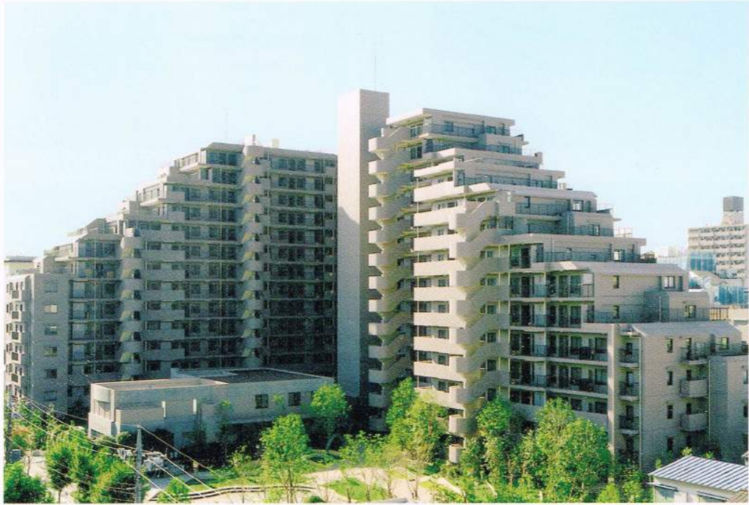
パークハイツ小豆沢